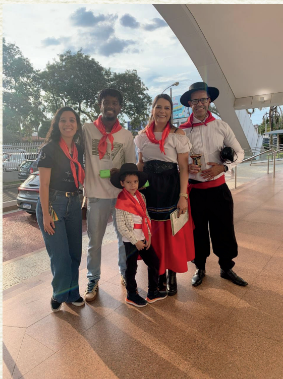
DE BOMBACHA E COM CHIMARRÃO NA MÃO: NO PRIMEIRO FIM DE SEMANA DE NOVEMBRO, A ESTREIA DO FESTIVAL FOI COM A REGIÃO SUL E A COMUNIDADE ENTROU NO CLIMA