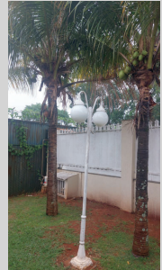
SUBSTITUIÇÃO DE GLOBO QUEBRADO