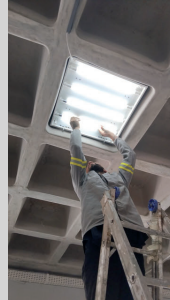
TROCA DE LÂMPADAS