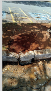
REPAROS DE MEIOS-FIOS