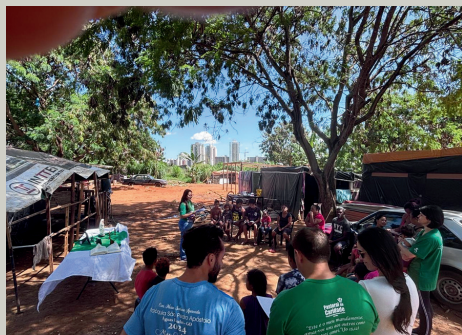
VOLUNTÁRIOS DA PASTORAL DA CARIDADE LEVAM ALIMENTO PARA O CORPO E PARA A ALMA EM ASSENTAMENTO NAS PROXIMIDADES DA CAESB, EM ÁGUAS CLARAS